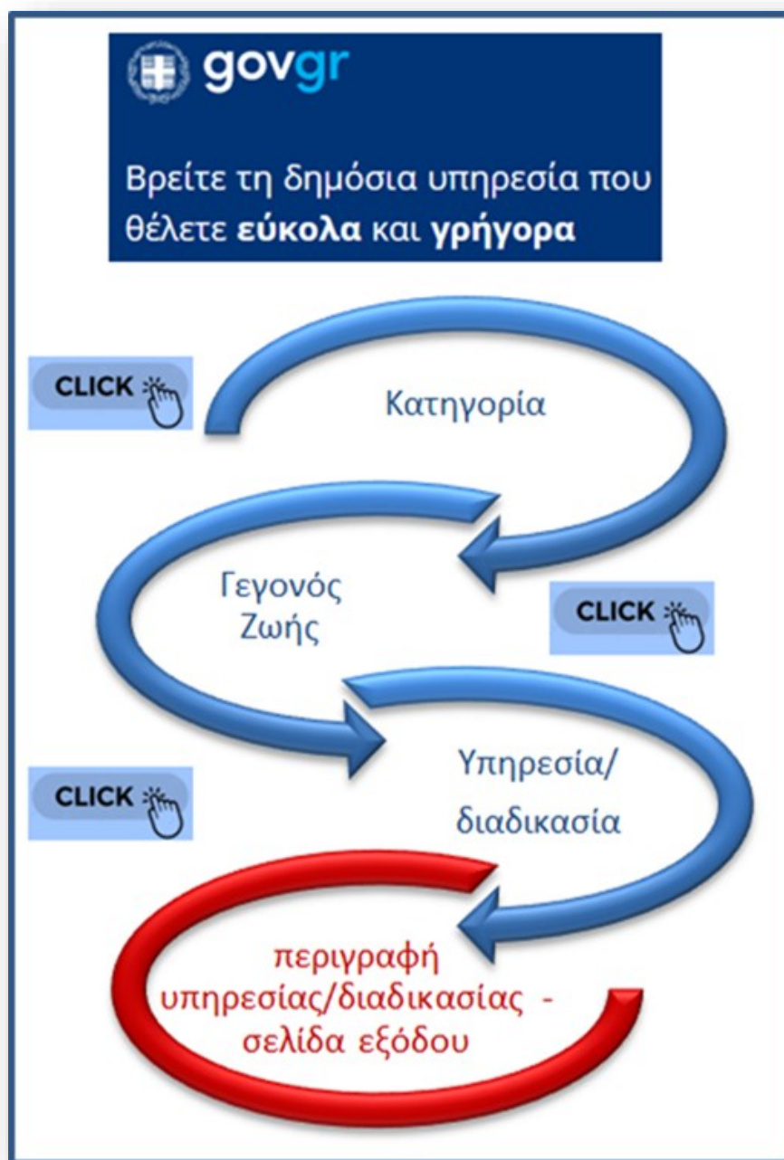
Εικόνα 2: Τα 3 clicks του πολίτη

Με τη συγκεκριμένη ταξινόμια στόχος είναι ο χρήστης με 3 clicks να εντοπίζει την υπηρεσία που ψάχνει.